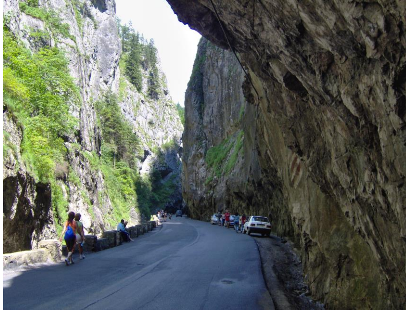
Gorges de Bicaz