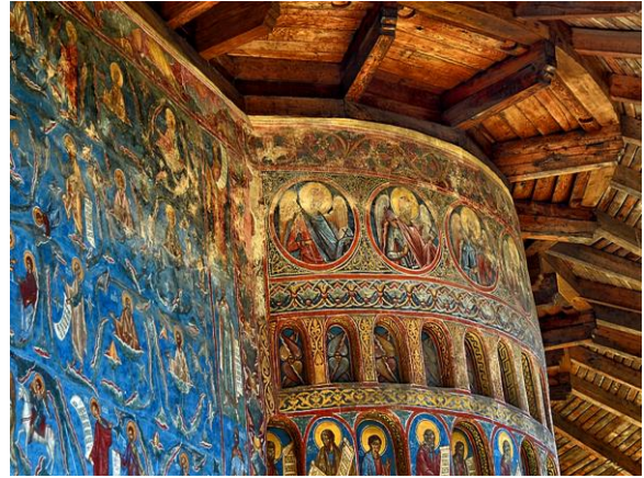
Sixtine de l'Orient