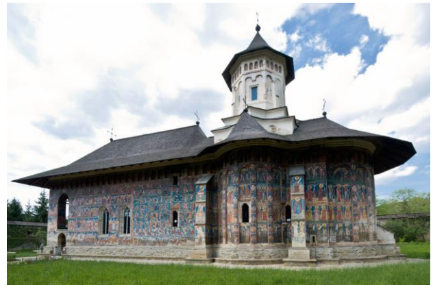
monastere de Moldovita