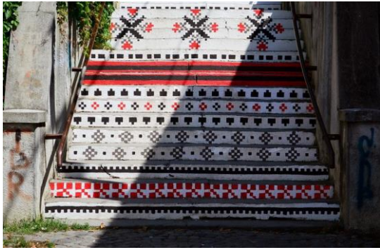
Targu Mures Bistrita