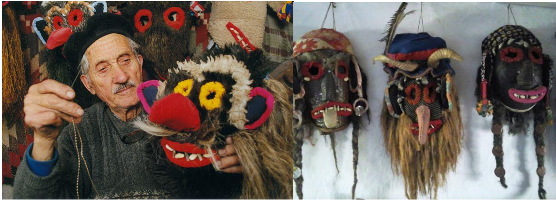
Creation de masques populaire

Visite du monastère Neamt/Agapia et traversée des gorges de Biczaz à pied (en fonction des conditions météo), poursuite vers le lac Rouge. Déjeuner dans un restaurant local Tarpesti/Lacu Rosu. Continuation pour Brasov . Installation à l'hôtel 3* pour 2 nuits. Diner libre.