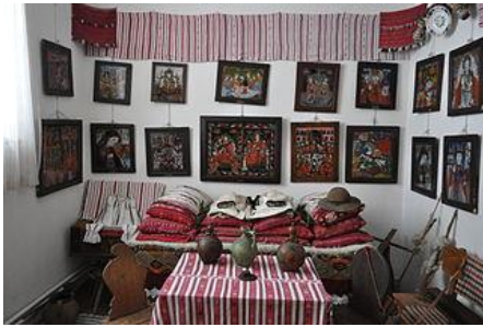
Musée des icônes sur verre

Départ vers Sibiel où vous visiterez le musée des icônes sur verre. Dîner avec des plats typiques a volonté (choux farcis, boulets de viande, fromage, légumes et fruits bio, apéritif – eau de vie et vin local) . Nuit chez l'habitant 3 marguerite (pension REGHINA), une occasion de partager et de connaître leurs traditions et coutumes.