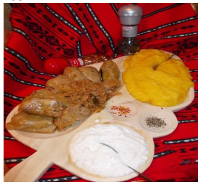
plat traditionnel roumain