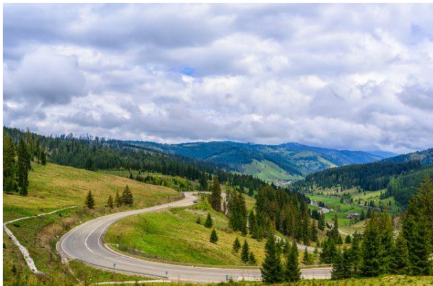
Paysage sur le route vers Campulung