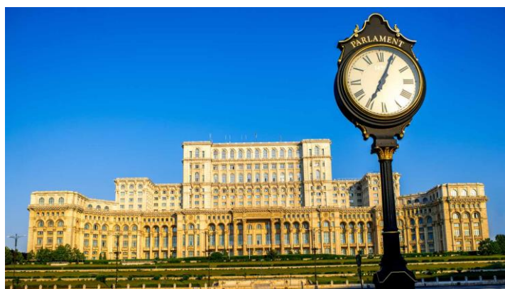
Palais du Parlement