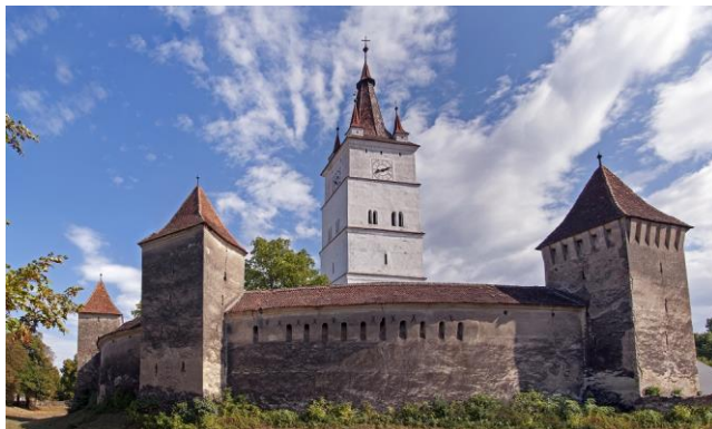
L'église fortifiée Harman

Ensuite route vers Bran et visite du célèbre château médiéval construit sur un rocher par les habitants de Brasov en 1377 pour défendre leur ville. Vlad a utilisé ce château comme quartier général pour ses incursions en Transylvanie. En 1922, la reine Marie le transforma en résidence d'été. Depuis quelques années, c'est un beau musée d'art médiéval. Retour à Brasov. Dîner libre à Brasov.