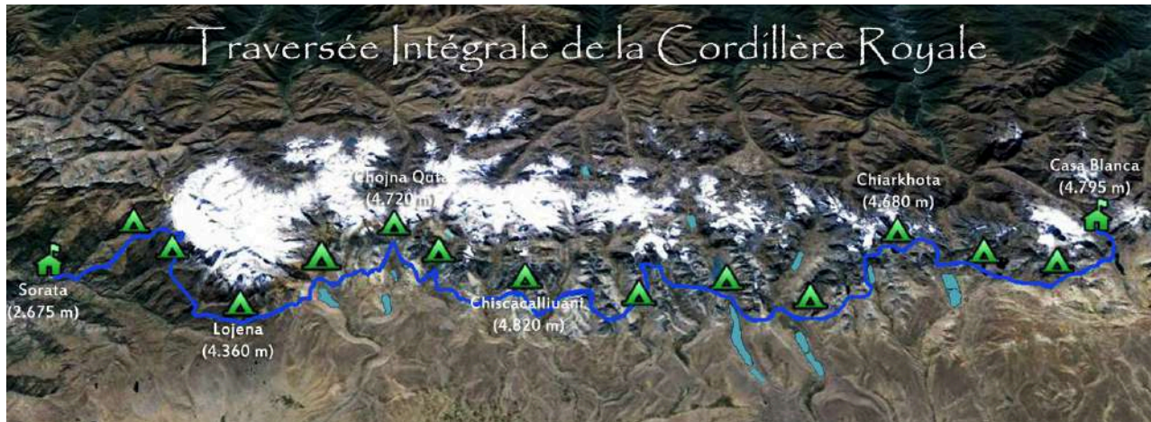
Traversée intégrale de la Cordillère Royale