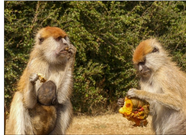
Le Cercopithèque de l'Hoest en lisière de Kibale Forest - Le singe rouge à Murchison Falls