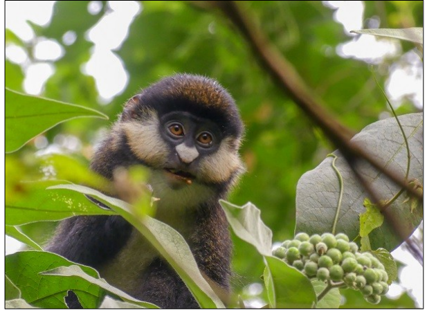
Le Cercopithèque ascagne en lisière de Kibale Forest