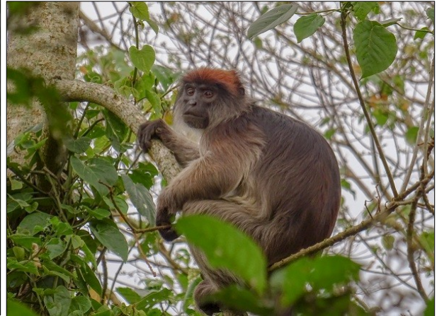
Images du Colobe roux d'Ouganda à Bigodi Swamp & Kibale Forest

ANECDOTES que je délivre sur site ou en débriefing le soir : n'approchez-pas trop près du colobe roux d'Ouganda (17.000 individus à Kibale-Bigodi et quelques populations reliques en Tanzanie). En effet, éméché s'il s'est gorgé de fruits bien mûrs, il devient agressif !! Quand les chimpanzés chassent ici, leur cible favorite reste ce colobe roux ; les mâles groupés tentent alors une défense mais subissent de lourdes pertes, ce qui explique le ratio mâle-femelle fort déséquilibré de cette espèce rare classée « en danger d'extinction ». Ici encore une fois, nos contributions en tant que touristes étrangers financent la protection de la Forêt de Kibale (770 km 2 ) et de ses animaux.